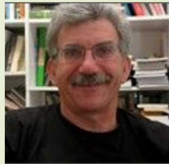
פרופ' ויקטור פרידמן